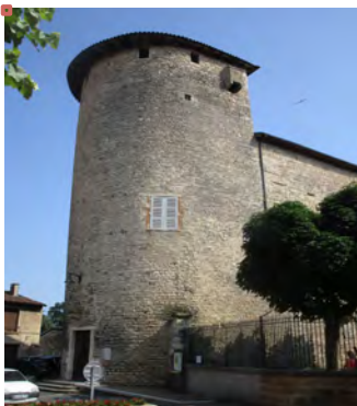
Figure 1 : Tour Nord

En 1218, la cour intérieure est séparée en deux par un corps de logis central.