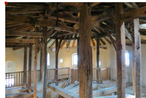
Figure 6 : Détail du hourd