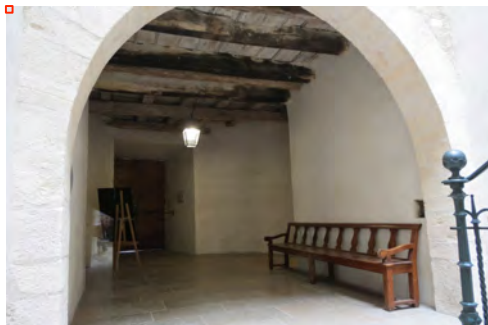
Figure 2 : Entrée cour nord

Du XV e au XVIII e siècle, le château connaît des modifications, sous l'intervention des mansionnaires, lui donnant un nouvel aspect à l'intérieur comme en façade : construction d'escaliers et de galeries transversales (XV e – XVI e ) ainsi que l'ouverture de nombreuses fenêtres (XV e – début XX e ).