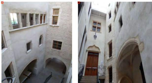
Figure 3 : Galeries cour Nord (XV e – XVI e siècle)

Au XVI e siècle, le hourd est lui aussi remanié : deux bretèches et un mur remplacent les éléments de charpente surplombant la tour nord. La bretèche armoriée défend la porte d'entrée d'origine.