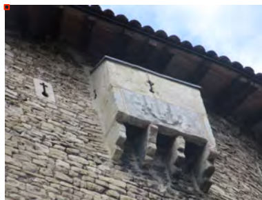
Figure 4 : Bretèche tour nord

Durant la révolution française, la confiscation des biens du clergé permet à la commune le rachat du château. Bâtiment public, il accueillera les services de la mairie, de la justice de paix et de la gendarmerie. De nos jours il est un lieu culturel dont la restauration a été récompensée en 2010 par le prix national des Rubans du Patrimoine.